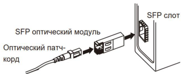
Рисунок 1. Подключение оптического модуля SFP

Модуль STEZ-SFP-LH-40-A предназначен для установки в разъем SFP со скоростью 1000 Мбит/с. Вставьте оптический модуль SFP в слот SFP коммутатора, а затем подключите оптоволокну к порту модуля SFP (рис. 1).